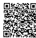
ประกาศกระทรวงฯ