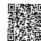
ระเบียบกระทรวงฯ